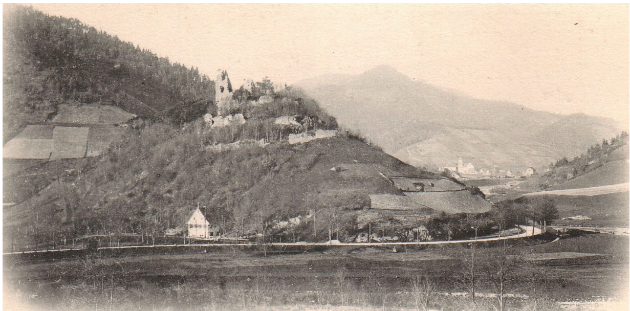
Die Ruine Schenkenburg um 1890